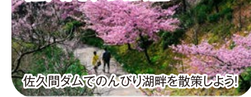
佐久間ダムでのんびり湖畔を散策しよう！