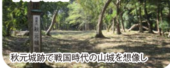
秋元城跡で戦国時代の山城を想像し