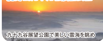
九十九谷展望公園で美しい雲海を眺め