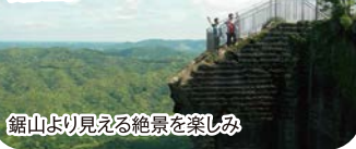
鋸山より見える絶景を楽しみ