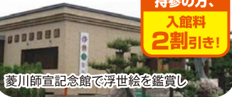
菱川師宣記念館で浮世絵を鑑賞し