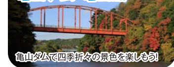
亀山ダムで四季折々の景色を楽しもう！