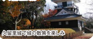
久留里城で城の散策を楽しみ