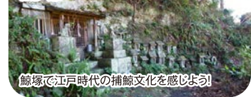
鯨塚で江戸時代の捕鯨文化を感じよう！