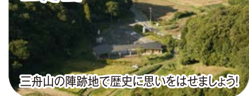
三舟山の陣跡地で歴史に思いをはせましょう！