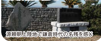
源頼朝上陸地で鎌倉時代の名残を感じ