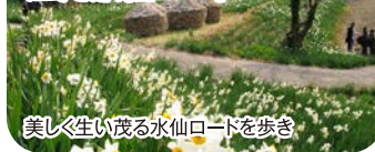
美しく生い茂る水仙ロードを歩き