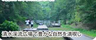
清水溪流広場で豊かな自然を満喫し